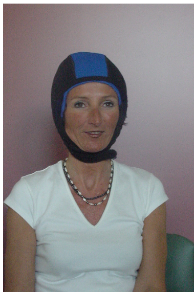
foto: Penguin ijskap